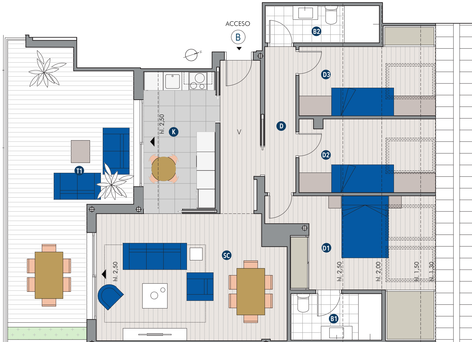
TIPO 13 PLANTA BAJO CUBIERTA ESCALERA 1 / LETRA B 3 DORMITORIOS / TERRAZA